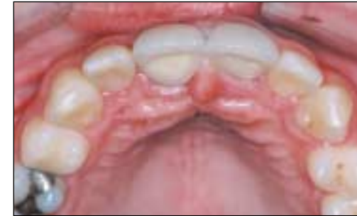
Resultado después de distracción.