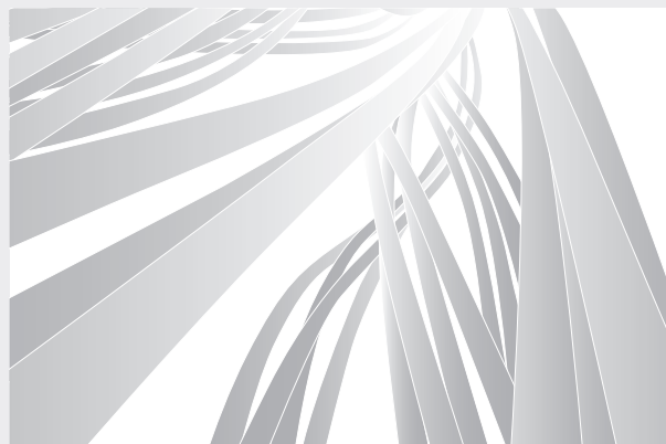
Antes de la implantación, el implante está compuesto por polímeros (cadenas moleculares largas).

En este folleto para el paciente encontrará toda la información y todas las indicaciones necesarias sobre SonicWeld Rx® y los implantes reabsorbibles de KLS Martin Group.