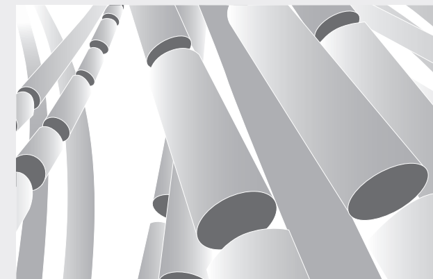
Tras la implantación comienza el proceso de degradación. Los polímeros se acortan cada vez más, hasta que solo quedan moléculas individuales.

Desde el principio, el implante reabsorbible absorbe el contenido de agua (moléculas de H 2 O) de los líquidos corporales circundantes (hidrólisis). El agua almacenada inicia el proceso de degradación del polímero. Por medio de la rotura continua de las cadenas de polímeros, las moléculas de agua descomponen las largas cadenas poliméricas en estructuras cada vez más cortas, hasta que solo quedan dióxido de carbono (CO 2 ) y moléculas de agua (H 2 O). Estas sustancias se excretan del organismo humano de forma natural.