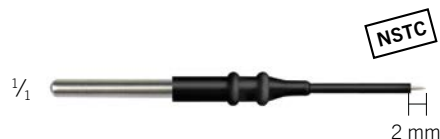
80-700-41-04 10 Aiguille pour microdissection en tungstène