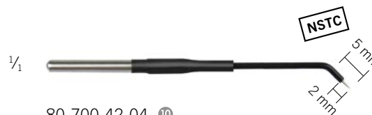
80-700-42-04 10 Aiguille pour microdissection en tungstène, 45°