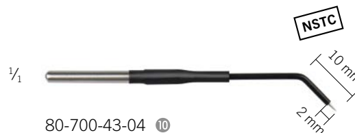
80-700-43-04 10 Aiguille pour microdissection en tungstène, 45°