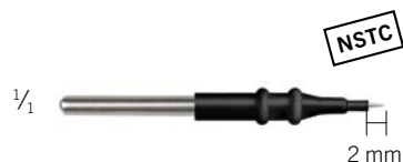
80-700-40-04 10 Aiguille pour microdissection en tungstène