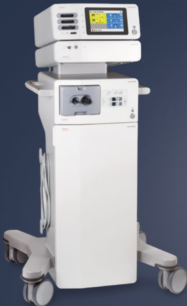
maxium® smart Cart